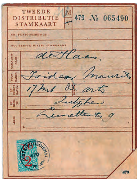
Vervalste en echte distributiekaart van dokter De Haas