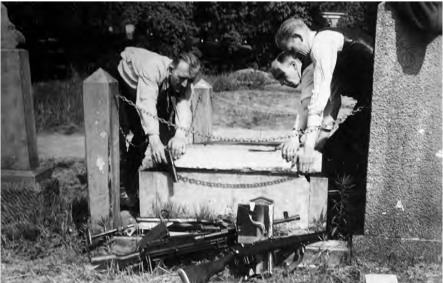
In scène gezette foto na de bevrijding op de begraafplaats