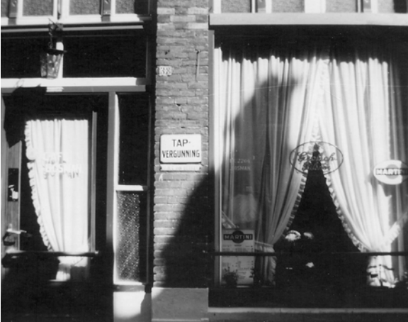
Afb. 5 Een naoorlogse foto van nummer 38, toen Bosman het café exploiteerde.

Je kon bij de burens gaan slapen, want op nummer 36 was een logement. Daar kon je kennelijk ook wel wat te drinken krijgen, want in 1919 kreeg J. Prins toestemming om op nummer 36 zwakalcoholische dranken te schenken in het 'beneden voorgedeelte'. Bijna aan het eind, op nummer 4, was, zoals het opschrift boven de deur vermeldt, tot en met 1930 ook een tapperij gevestigd, met eerst Leemrijse en later Ter Schegget als exploitant. Dit café had de naam Een oog in 't Zeil (afb. 6).