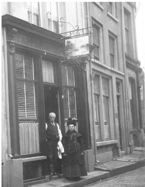
Afb. 6 De tapperij Een oog in 't Zeil van Leemrijse rond 1900.

Je kon bij de burens gaan slapen, want op nummer 36 was een logement. Daar kon je kennelijk ook wel wat te drinken krijgen, want in 1919 kreeg J. Prins toestemming om op nummer 36 zwakalcoholische dranken te schenken in het 'beneden voorgedeelte'. Bijna aan het eind, op nummer 4, was, zoals het opschrift boven de deur vermeldt, tot en met 1930 ook een tapperij gevestigd, met eerst Leemrijse en later Ter Schegget als exploitant. Dit café had de naam Een oog in 't Zeil (afb. 6).