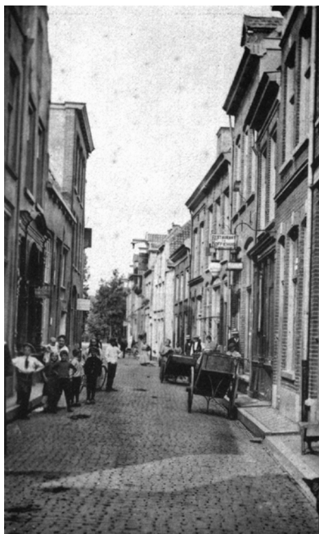
Afb. 4 Prentbriefkaart uit het begin van de 20ste eeuw. De handkarren staan ongeveer voor nummer 38. Op het uithangbord staat: Restaurant en Koffiehuis.